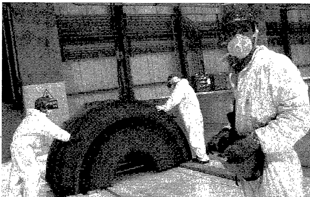
Una centrale nucleare

dendo di accelerare sull'avvio dell'Agenzia per la sicurezza nucleare, e che avrebbe incontrato Umberto Veronesi ed Emma Bonino per «un franco confronto sul questa sfida». Esprime apprezzamento anche il ministro degli affari regionali Raffaele Fitto, due volte battuto da Nichi Vendola in Puglia, e chiaramente felice di poter ricambiare con una bella centrale nucleare nel Tavoliere. «La sentenza della Corte costituzionale - ha dichiarato - conferma il principio della competenza nazionale su questioni dalle quali dipende il futuro del paese nel suo complesso oltre che dei singoli territori. È evidente che le prese di posizione, inutilmente polemiche, di alcuni presidenti di regione si dimostrano finalizzate solo a strumentalizzazioni politiche». I Verdi prendono atto della decisione della Consulta, ma ritengono che la partita sia aperta: resta ancora in campo il ricorso contro il decreto attuativo della legge. «Intanto - ha aggiunto il presidente Angelo Bonelli - il governo non ha ancora avuto il coraggio di dire agli italiani i siti dove intende costruire le centrali atomiche. Ma non riuscirà a farle perché la mobilitazione popolare glielo impedirà». E alla società civile si appella anche l'Italia dei Valori: «Come volevasi dimostrare il referendum è l'unica arma per bloccare la costruzione delle centrali nucleari. Al di là della sentenza della Consulta, questo progetto del governo rimane un'obbrobri». Ma il Pd, neanche a dirlo, già si dichiara «pronto a discutere».